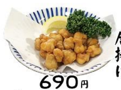
フライドポテト 鶏ナンコツ 唐揚げ