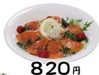
サーモンのカルパッチョ ウイシナー